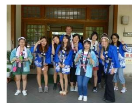
Festival in Noto

In addition to the aforementioned compulsory courses, students are encouraged to take courses related to their field of research regularly offered by various faculties to the Japanese students. At the beginning of each semester guidance will be given on the registration procedures for these courses.