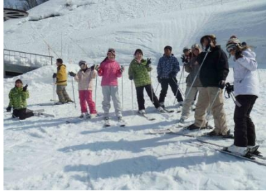
Skiing in Hakusan